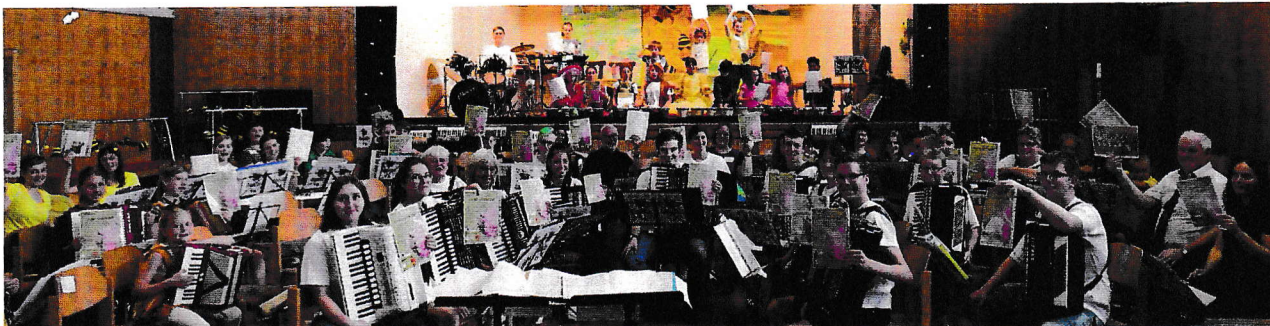
Benefizkonzert der DHV-Akkordeonjugend .